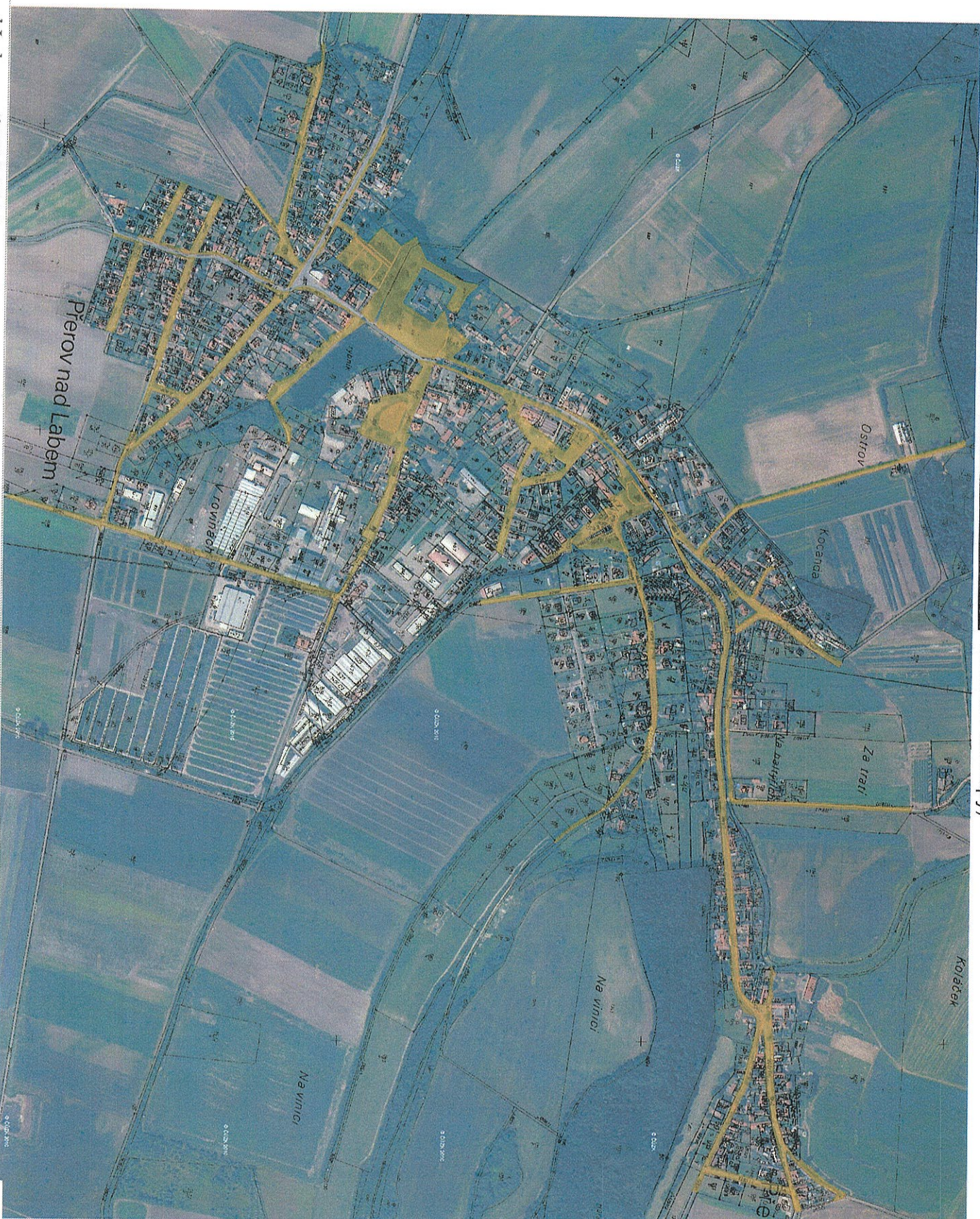
Príloha č. 2 – určenie verejných priestranstiev dle článku 9 této vyhlášky (Zakreslení do mapy)