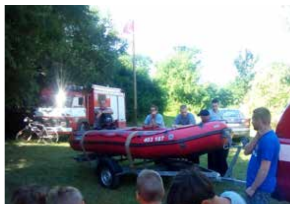
léto: Okrsková soutěž v požárním útoku