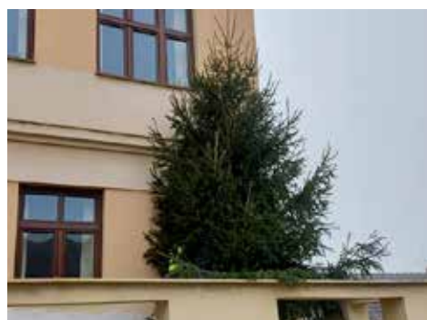
Mikuláš si našel cestu i na obecní úřad