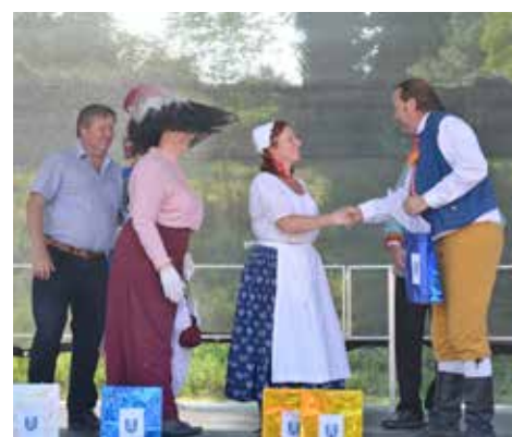
podzim: Historické dožínkové slavnosti ve Skanzenu