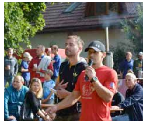
podzim: Přerovský sedmiboj